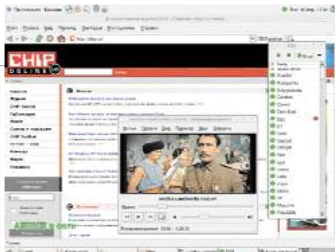
Базового набора программ в дистрибутиве с лихвой хватает на все случаи жизни

Полная коробочная версия ASPLinux Deluxe включает в себя десять установочных компакт-дисков и один DVD